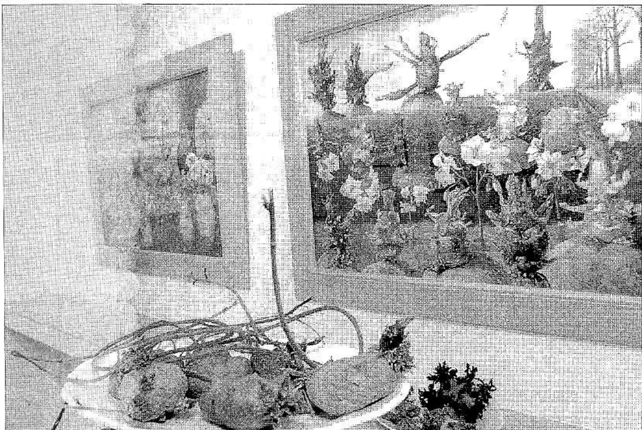
Aardappelen in alle soorten, maten en gedaanten. Dina Belga penseelt ze als pootgoed, verdroogd of juist geschikt voor consumptie maar ook figurerend in landschappen. Op de voorgrond een schaal uitgelopen piepers.

Dina Belga schildert ze in alle gedaanten: met dag- en nachtkiemen – want in het donker ontspruiten ze anders dan bij daglicht – ze penseelt ze als pootgoed, verdroogd of juist geschikt voor consumptie maar ook figurerend in landschappen – 'Ode aan de Noord-Oostpolder' – of in combinatie met een tulp of