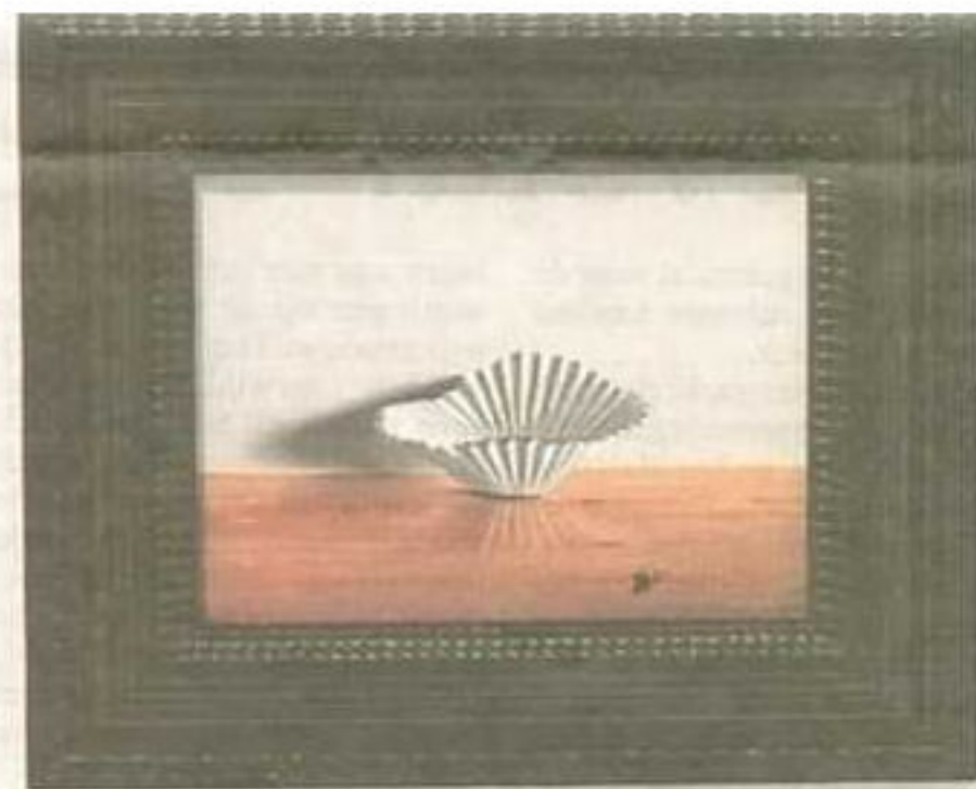
Het drieluik 'Voorspel', 'Tussenspel' en 'Naspel' van Rob Møhlmann in Museum Møhlmann in Venhuizen.

De dop verwijst samen met de Franse driekleur, (gevormd door een rechtop gezet vliegenierspeldje), subtiel naar de overname van de Hollandse jeneverfabriek door de Franse